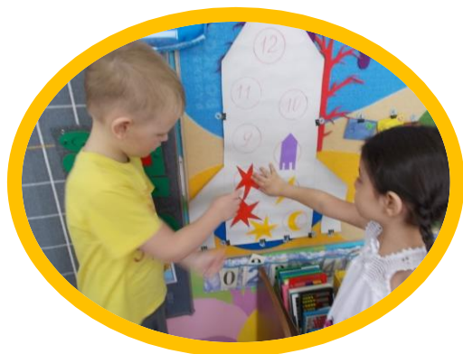
Адвент-календарь в ожидании Дня космонавтики.