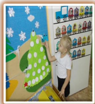
Адвент-календарь в ожидании Нового года.